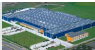
Hörmann KG Brandis