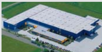
Hörmann KG Dissen