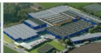
Hörmann KG Brockhagen