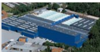
Hörmann KG Amshausen