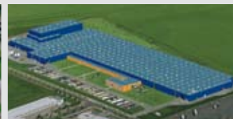
Hörmann KG Ichtershhausen