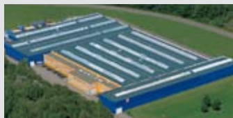
Hörmann KG Eckelhausen