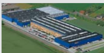
Hörmann KG Werne