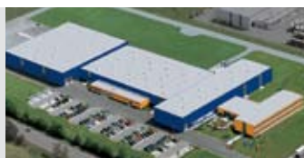
Hörmann KG Antriebstechnik