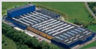
Hörmann KG Freisen